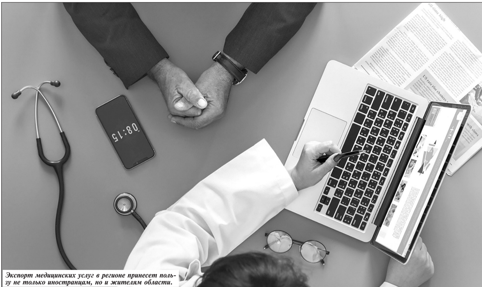
Экспорт медицинских услуг в регионе принесет пользу не только иностранцам, но и жителям области.

Брянская медицина готова лечить иностранцев