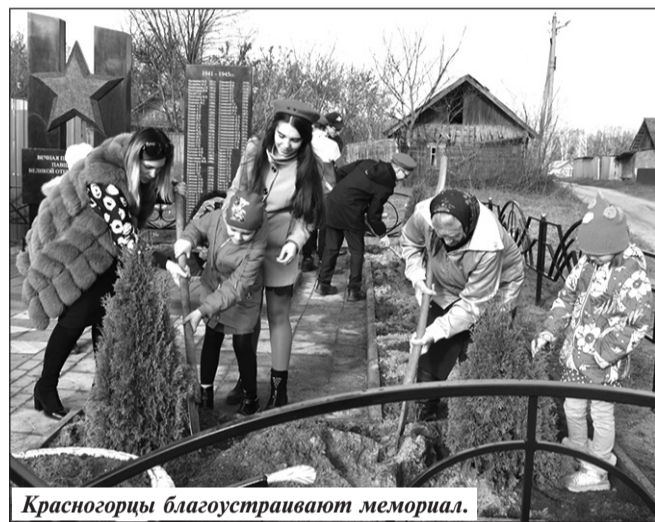
Красногорцы благоустраивают мемориал.

На Совете принято решение войти в Национальную ассоциацию развития местного самоуправления. Это позволит получить дополнительное финансирование и откроет новые возможности для изучения передовых методов местного самоуправления.