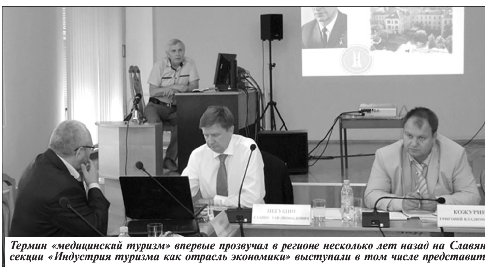
Термин «медицинский туризм» впервые прозвучал в регионе несколько лет назад на Славянском экономическом форуме, где на секции «Индустрия туризма как отрасль экономики» выступали в том числе представители лечебных учреждений области.